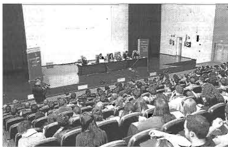
Vista del salón de actos de Ingeniería Informática durante el foro.