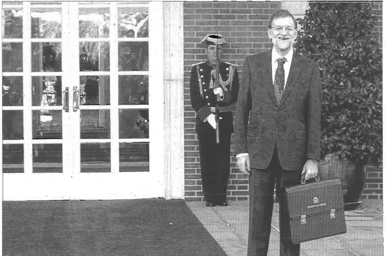
El presidente del Gobierno, Mariano Rajoy, en la puerta del Palacio de la Moncloa.

El Gobierno está dispuesto, asimismo, a reformar la estructura y contenidos de la negociación colectiva –labor en la que están empeñados CEOE y los sindicatos UGT y CCOO– con el objetivo de que se negocie cada materia en el ámbito territorial o sectorial que asegure la optimización de la competitividad. La resolución extrajudicial de los conflictos, ha asegurado el presidente, se poten-