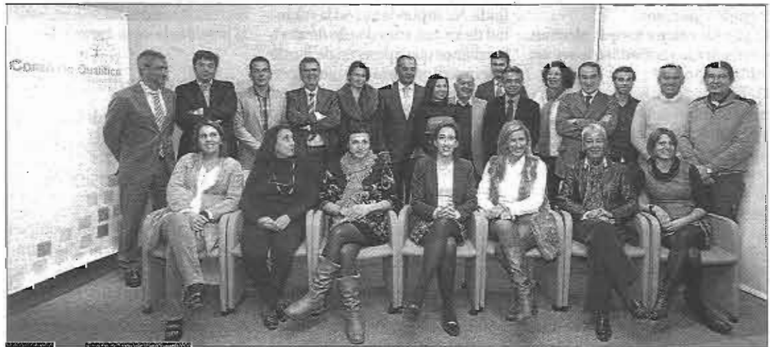
Los firmantes de los acuerdos de constitución de los clubes de producto.

A través de las actuaciones llevadas a cabo con estas empresas se ha pretendido favorecer su adaptación en aspectos como la sostenibilidad, la accesibilidad, el uso de nuevas tecnologías, la calidad, la responsabilidad social, etc., buscando segmentos turísticos bien estructurados que sean un complemento a la oferta de sol y playa y fa-