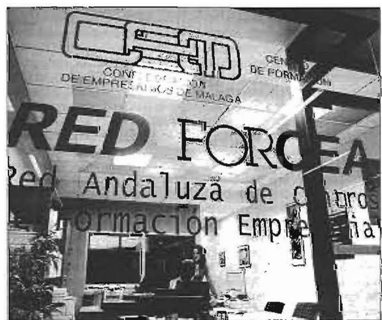
Centro de formación empresarial de la CEM. L. O.

El programa establecido para esta actividad comprende módulos formativos dedicados a responsabilidad legal, herramientas para la gestión preventiva en la empresa, consultoría de seguridad, ergonomía e higiene, integración de la prevención con otros sistemas de gestión, auditoría de sistemas de gestión y calidad, y se pedirá a los participantes un proyecto.