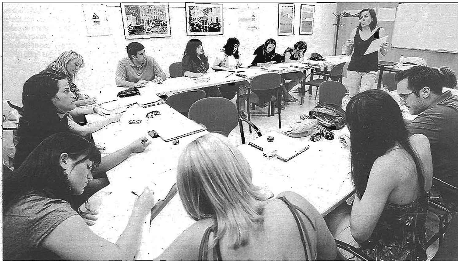
Uno de los cursos de formación impartidos en la Confederación de Empresarios de Málaga (CEM). L. O.

En lo que se refiere a docencia y medios disponibles, la CEM cuenta con un nutrido grupo de profesores del ámbito de la Universidad y del mundo empresarial, y con aulas con material audiovisual y ordenadores que permiten una enseñanza avanzada. Respecto a la metodología de impartición, se combinan exposiciones por parte del profesor, trabajo individual y en pequeños grupos, puesta en común, y exposición y debate sobre casos prácticos. La metodología práctica se completa con visitas a empresas e