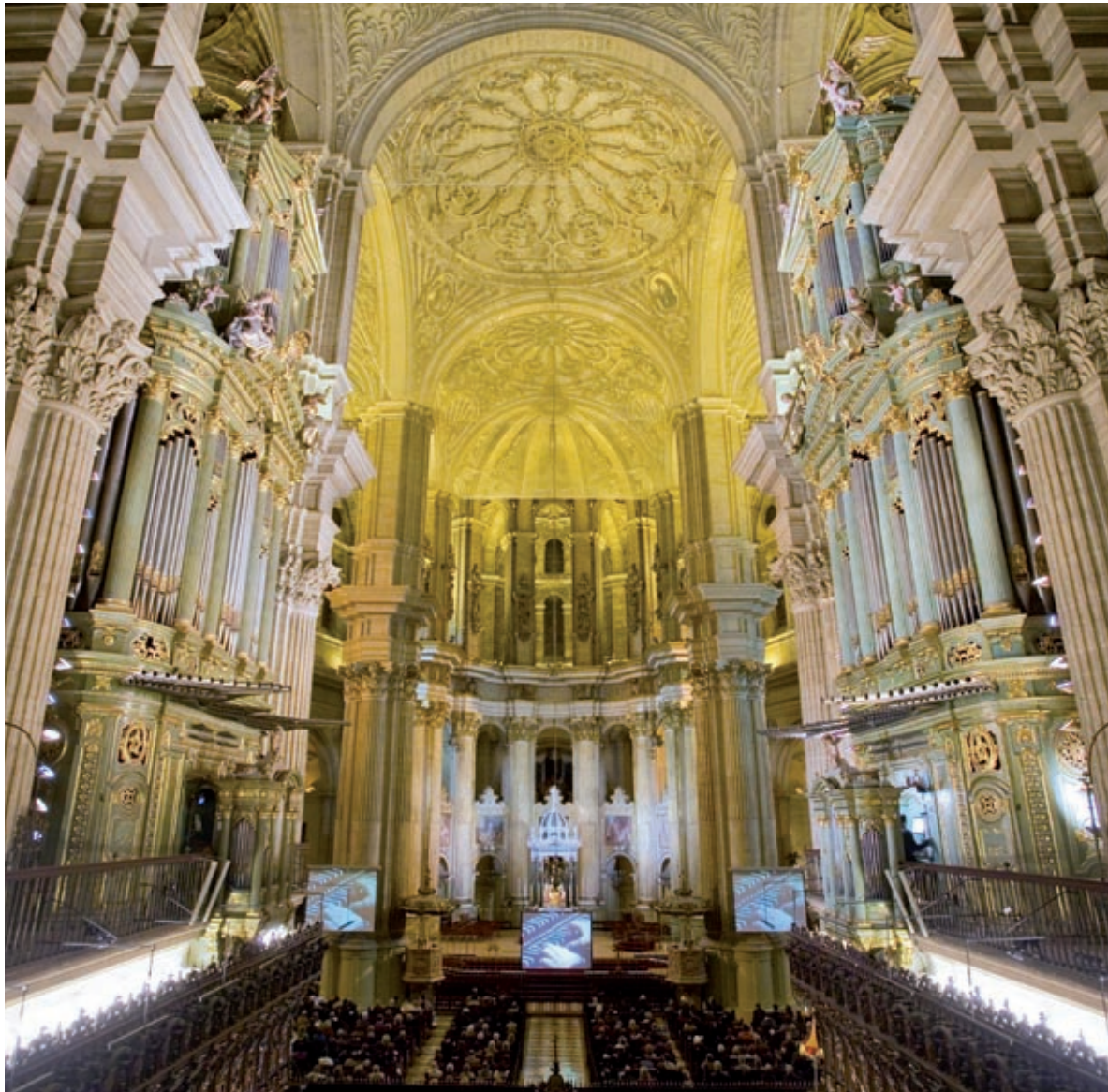
Los conciertos de la Fundación CEM se celebran en la SIB Catedral de Málaga.

Durante el ejercicio 2010 hemos avanzado en la tarea de dar a conocer el objeto social de nuestra Fundación trasladando a distintos ámbitos sociales la labor de patrocinio y mecenazgo y de fomento cultural y docente por la que se constituyó, así como se ha afianzado el papel de nuestra Fundación por medio de la consolidación de algunas de las actividades que desde su constitución ha contribuido a realizar.