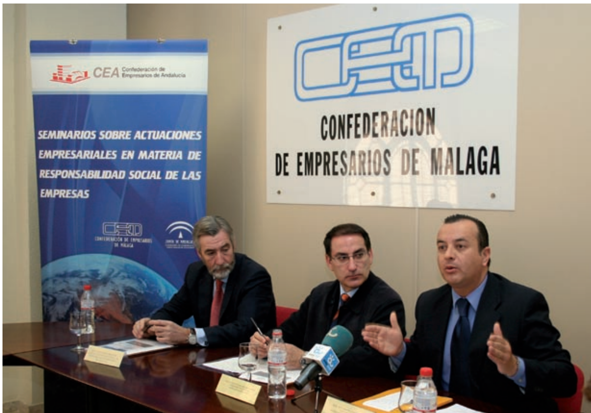
Seminario formativo sobre Responsabilidad Social Empresarial en la sede de la CEM.

Desde la CEM se intenta dar la mayor difusión posible a estas actuaciones en el mundo empresarial, a fin de que se pueda visualizar cualitativa y cuantitativamente la destacada labor que llevan a cabo, siempre desde el respeto a la voluntariedad, las empresas de la provincia, así como su aportación social y económica a través de múltiples y diferentes acciones.