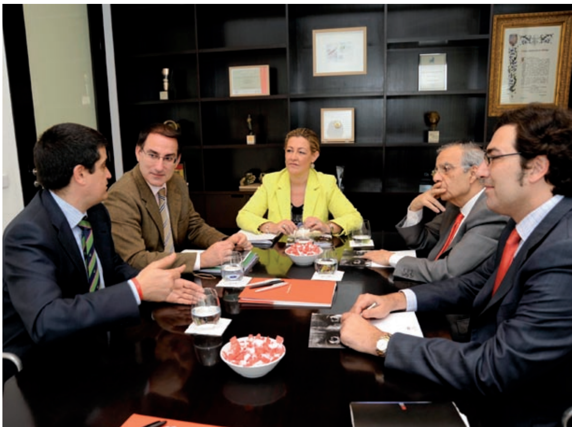
Reunión en la Delegación de Cultura en el marco de las actividades de la Fundación CEM.